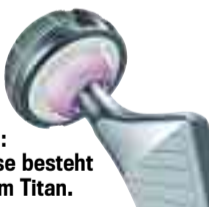
Moderne Materialien: Die Prothese besteht aus stabilem Titan.

ven OP-Methode kommt es weniger auf die Länge des Schnittes an, sondern auf die dabei entstehenden Verletzungen in den Weichteilen unter der Haut“, erklärt Nolde. „Je weniger Weichteile verletzt, desto besser funktioniert die neue Hüfte auch langfristig.“ Deshalb hält Nolde die neue Technik für intelligent, erfolgreich und medizinisch sinnvoll: „Dieser Zugang von Vorne zur Hüfte ist direkt, sehr kurz und sehr schonend,