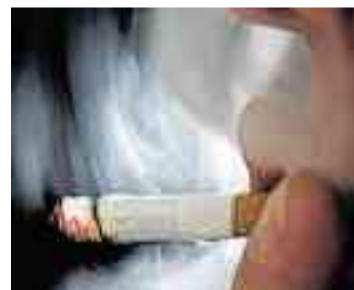
Einfach aufhören? Viele schaffen es nur mit Hilfe von Profis.

Aufhören wollen viele, doch alleine schaffen es nur wenige: Sehr erfolgreich sind professionelle Kurse zur Tabakentwöhnung, die von einem erfahrenen Lungenspezialisten und einem Psychologen begleitet werden. Dafür finden am Donnerstag, 3. März, und am Donnerstag, 10. März,